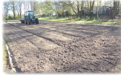
Anwalzen vor dem Aufbringen der Saat