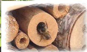
<<<<< Ein Gast

Ein feinmaschiger leichter Drahtzaun könnte ggf. Vorder- und Rückseite abdecken und bewahrt die Larven, Eier und Puppen vor den Vögeln. Allerdings ist diese Maßnahme umstritten: denn, wenn sich die Vögel dort mit Nahrung bedienen, ist es Natur.